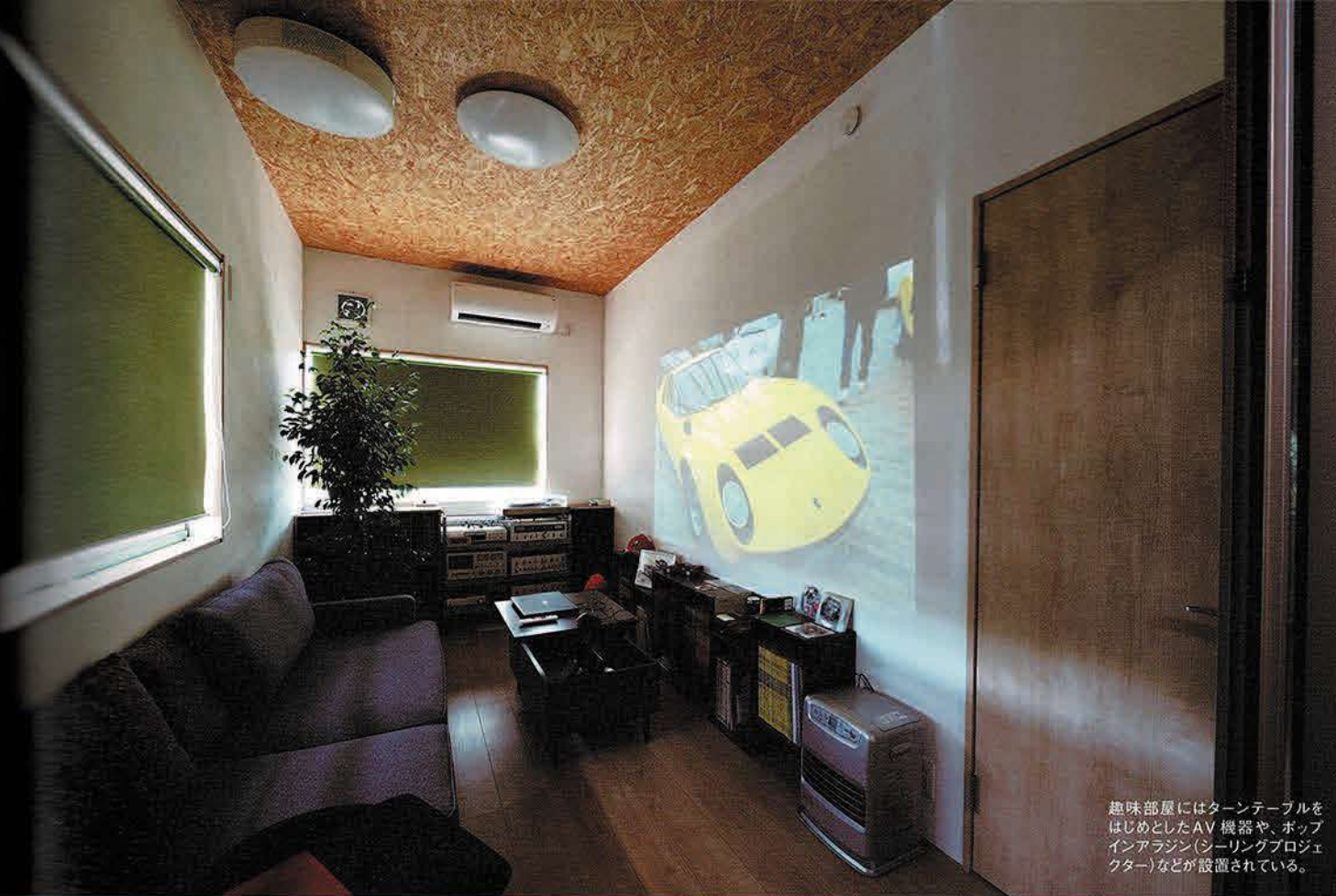
趣味部屋にはターンテーブルをはじめとしたAV機器や、ポップインアラジン(シーリングプロジェクター)などが設置されている。