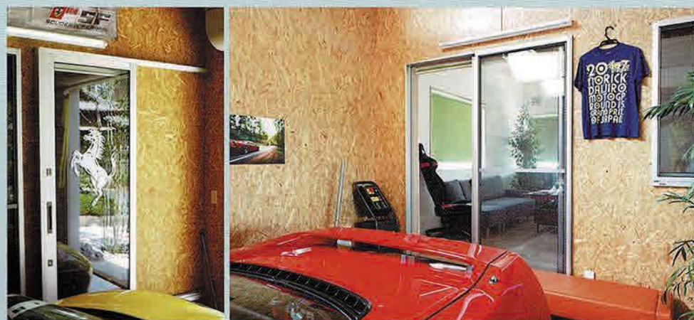
左/エントランスホールとガレージを繋ぐために設置したスライドドア。土間部分が続くよう開きを反対にすればよかったということ。 右/ガレージ後方には趣味部屋が設けられている。ここがガレージでもっとも気に入っている空間だ。