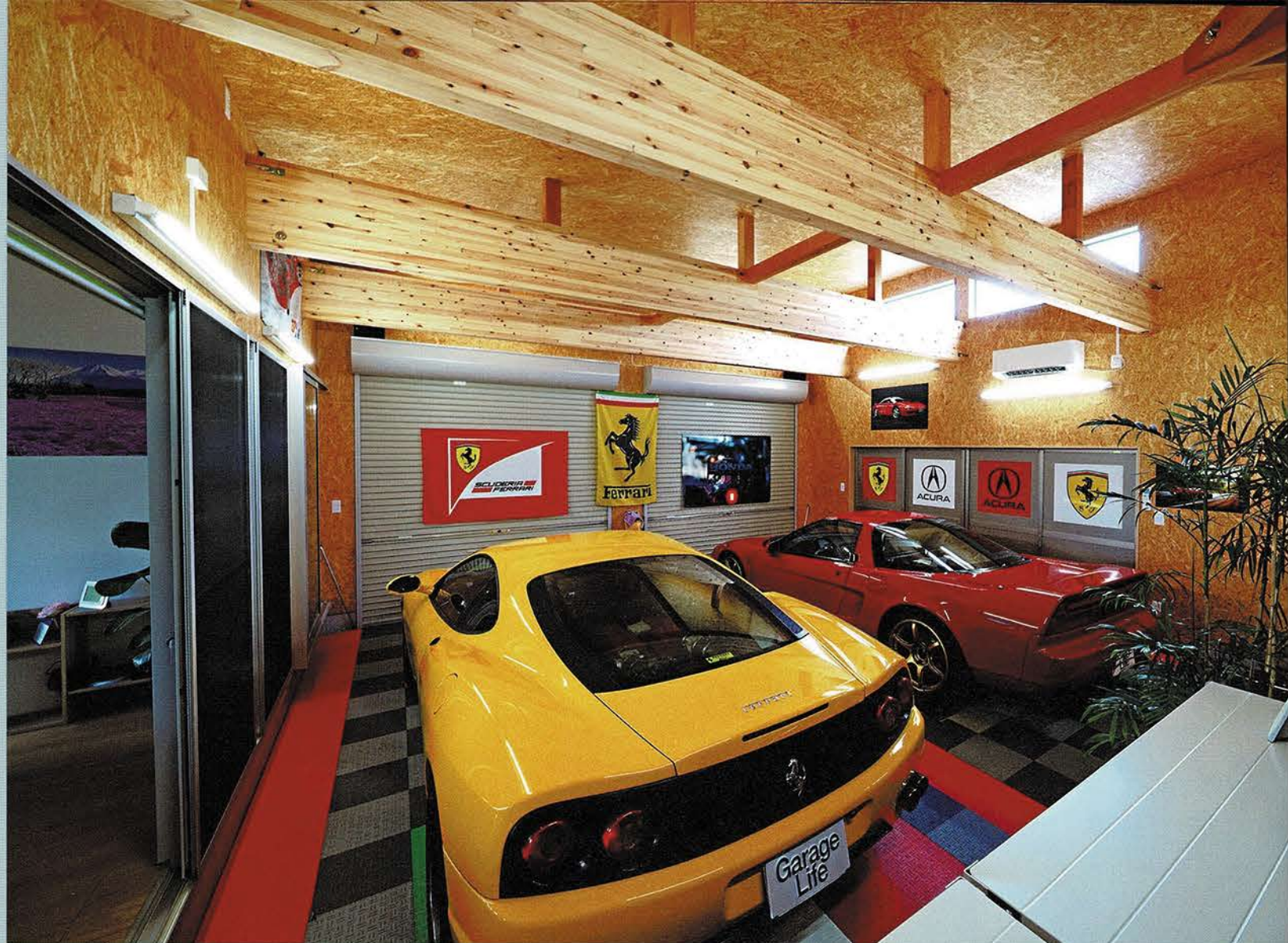
集積材の太い梁を使った木造在来工法にて、広々としたガレージ空間を実現している。NSX 側にはリフトが設置され、天井も高く設定。