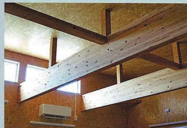
左/構造の梁があらわしとされているほか、壁面や天井はOSB合板とされており、木材ならではのぬくもりを感じられるガレージとなっている。 右/ガレージシャッター1枚の開口幅は2700mm。タペストリーはマジックテープで張られ、そのまま巻き上げることができる。