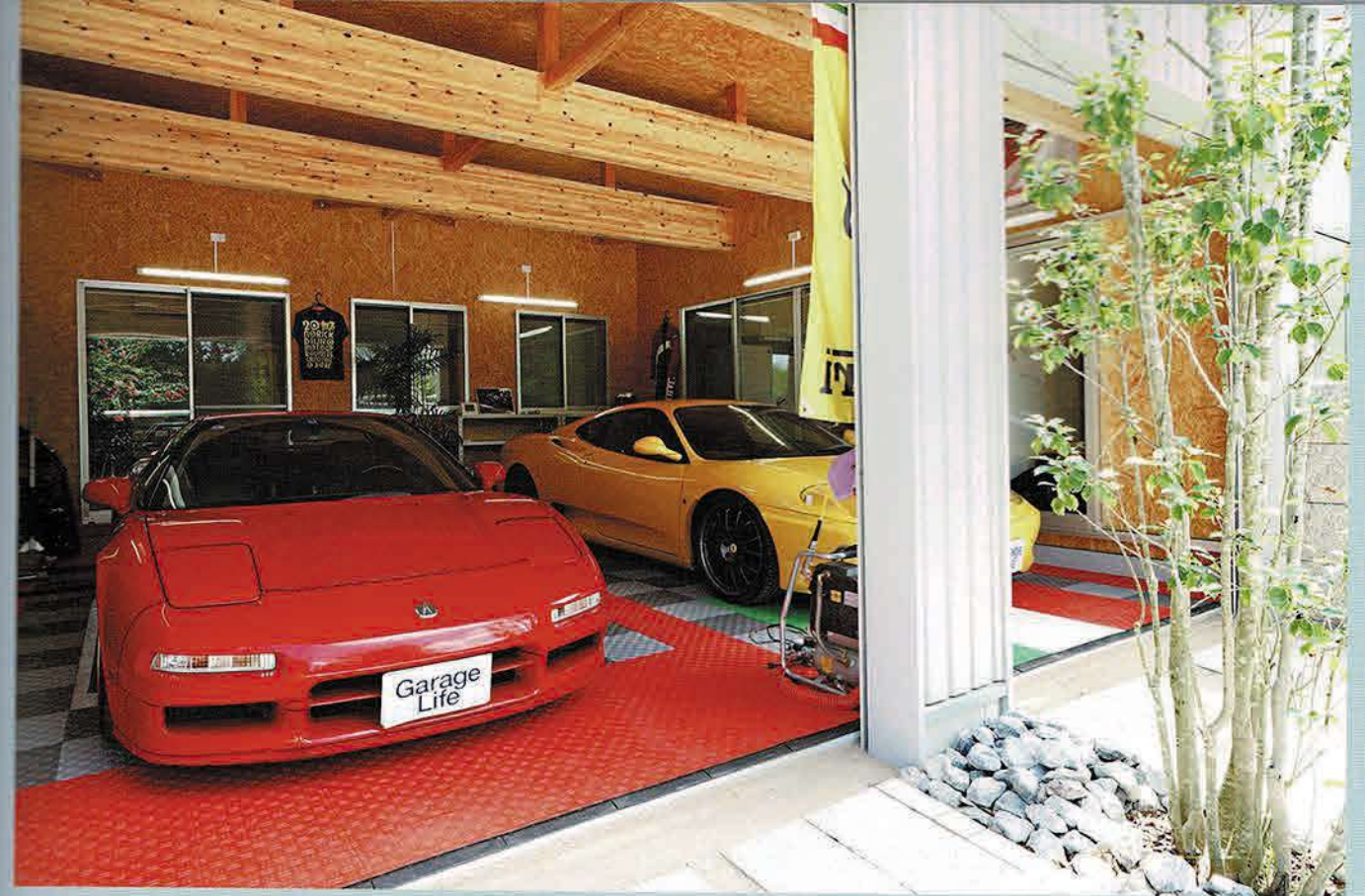
平成5年に手に入れてから現在まで乗り続けてきたアキュラ・NSX。フェラーリは6年前に増車している。