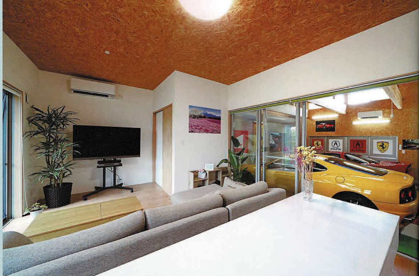
ガレージ脇にはLDKスペースが用意されている。ガレージとできるだけグラウンドレベルを近づけるように設計した。