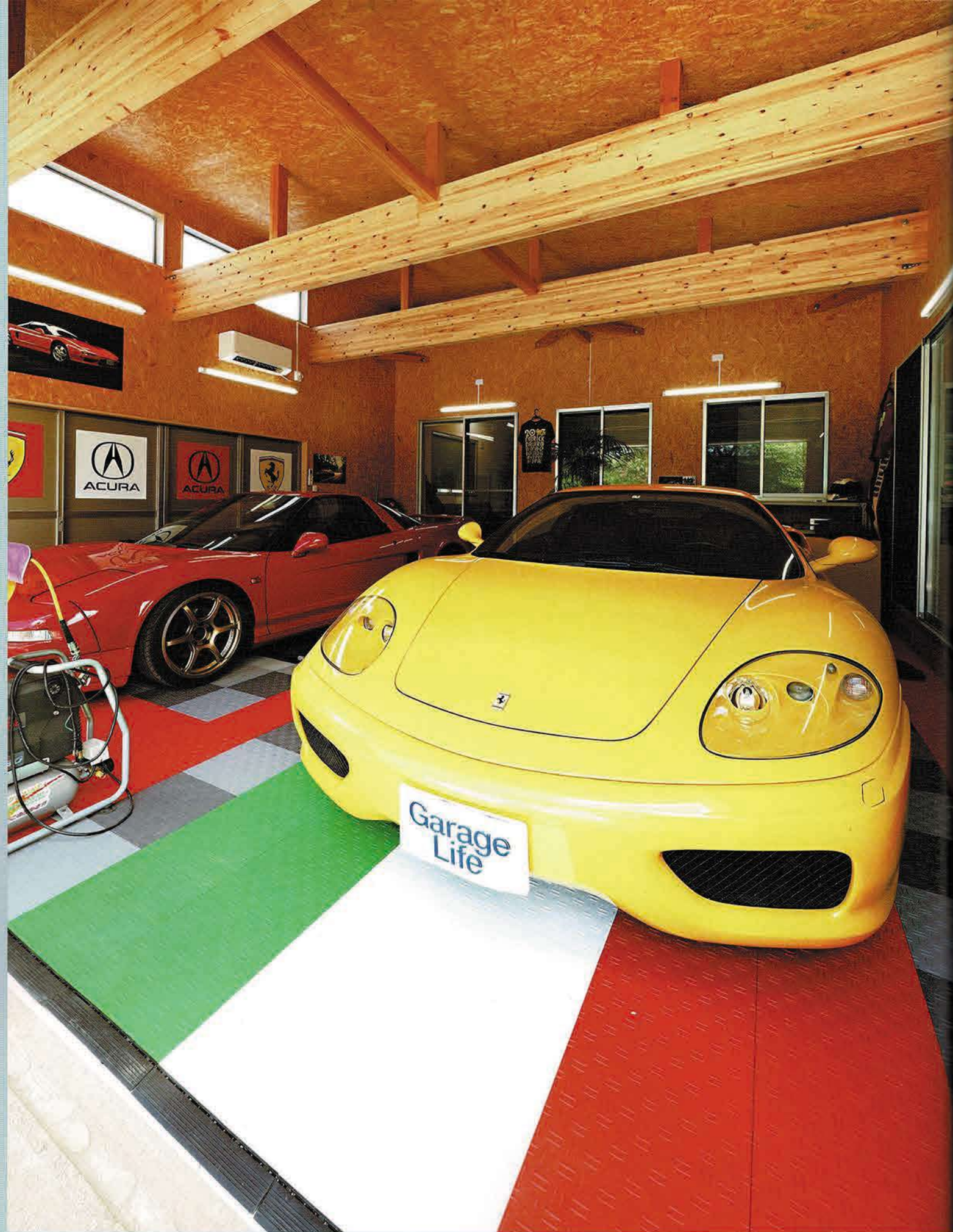
フェラーリ・360 モデナが置かれるスペースの前方は「テックタイル」を用いてトリコロールパターンをあしらっている。