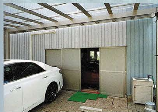
ガレージを建てた場所にもともとあった倉庫に使っていた引き戸をリユースしている。この場所から出入りすることも多いそうだ。

当初からリフトの設置を想定していたと言うガレージは天井が高く開放的、集積材の強固な梁